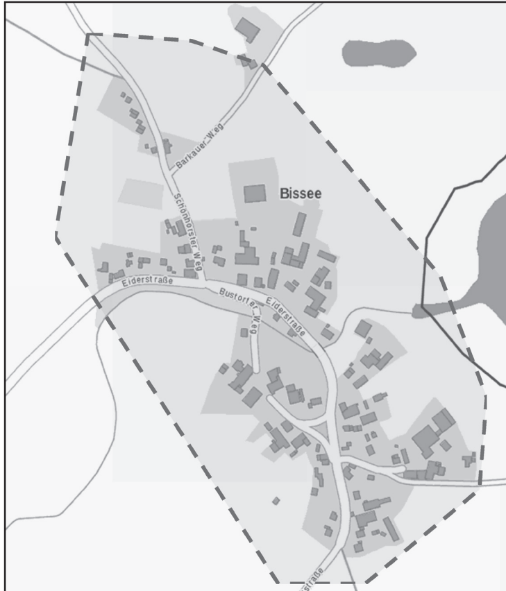
Lageplan zu IV. - Abbrennverbotszone Bissee I – Ortsgebiet

Der Bereich ist im Lageplan entsprechend dargestellt.