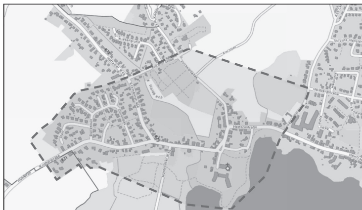
Lageplan zu II. - Abbrennverbotszone Bordesholm I – ‚Klosterinsel‘

Der Bereich ist im Lageplan entsprechend dargestellt.