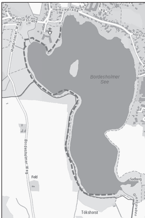
Bildliche Darstellung der Leinenpflicht

Aus aktuellem Anlass informiere ich Sie über die bestehende Leinenpflicht in bestimmten Bereichen des Rundweges um den Bordesholmer See. Der Bereich erstreckt sich vom Fußweg „Klosterufer“ bis zum Ende des Naturwaldes im Bereich der Gabelung zum Straßenzug „Tökshorst“.