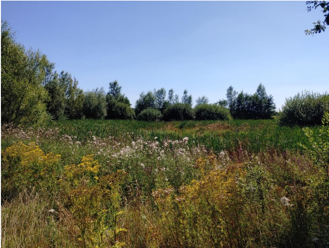
Abb. 2.3 Schilfröhrichtbiotop, nicht im Vorhabenbereich gelegen.