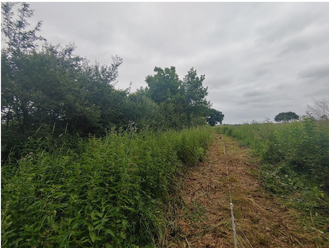
Abb. 2.4 Feldgehölz, welches an den Vorhabenbereich angrenzt.