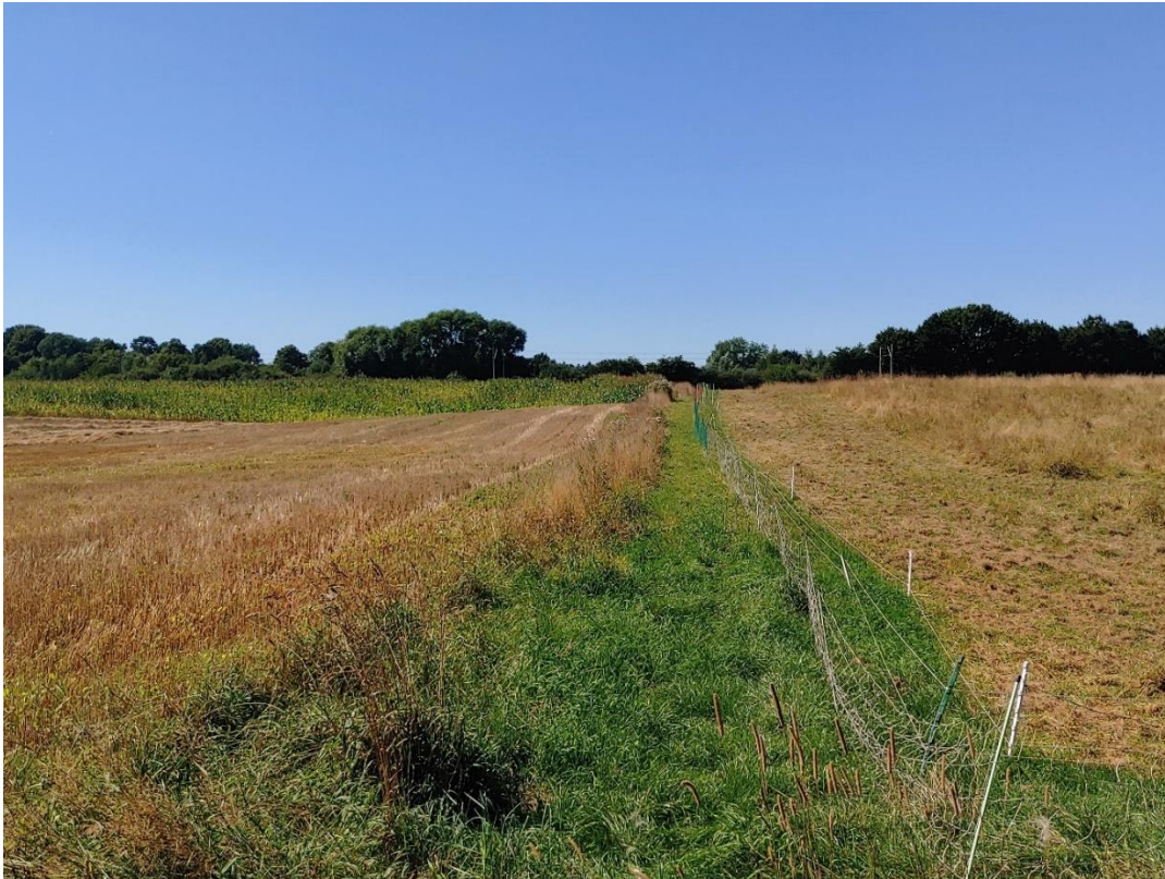
Abb. 2.1 Links auf dem Bild (Süden) Intensivacker; rechts des Zaunes (Norden) zum Zeitpunkt der Begehung mäßig artenreiches Grünland