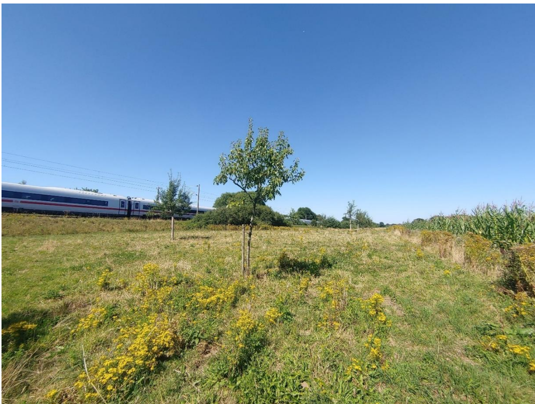
Abb. 2.2 Streuobstwiese im westlichen Teil des Vorhabengebiets.